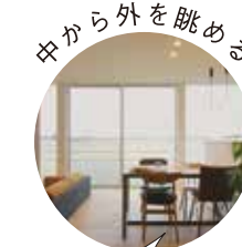
中から外を眺める 今日は晴れてるな〜

料理や洗濯物・お風呂場を洗うなど、水廻りを集約し、家事を便利に快適に時間短縮できるのも平屋のいいところ。2階や段差がないので、生活設計が立てやすいと言えます。